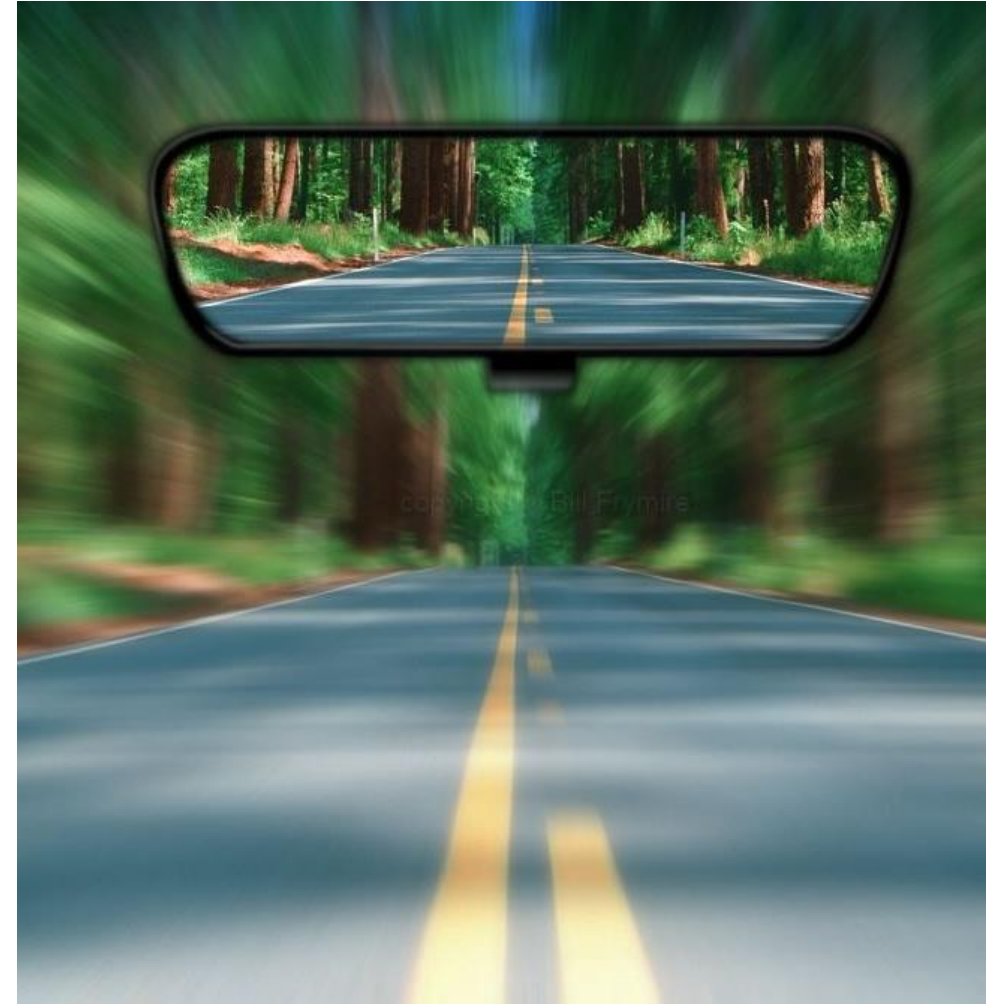
Sturen met klassieke P&O instrumenten

Buurman benadrukt dat de zorg niet voorbereid is op de voorspelde vraag naar ouderenzorg in de komende twintig jaar. In de verpleeghuizen zijn de komende jaren 130.000 extra plekken nodig, terwijl er nu al een tekort is aan woningen. Vooral het tekort aan gekwalificeerde medewerkers is het probleem, vooral binnen de wijkverpleging en ouderenzorg.