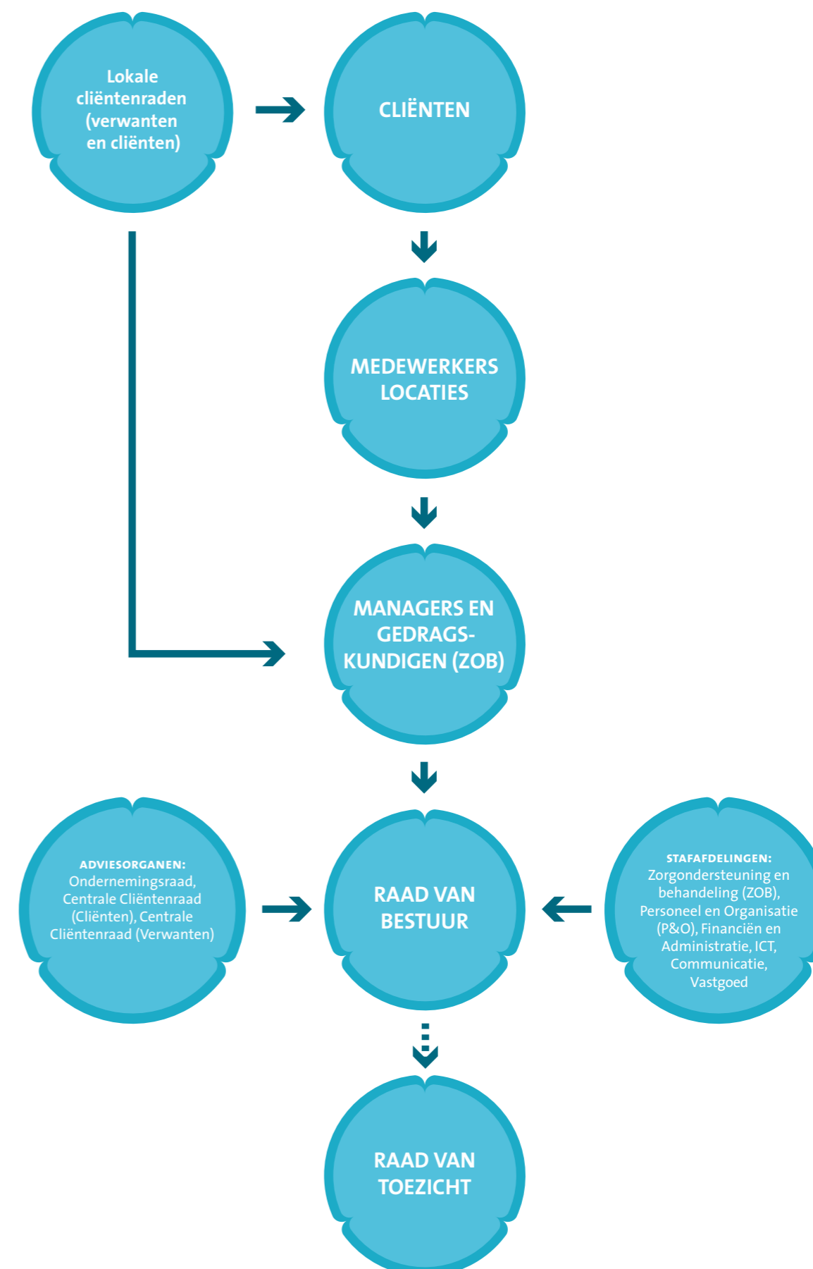
Figuur 1 Organogram Aveleijn