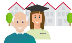
Wonen en zorg bijna net als thuis