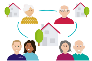
Wonen met een +