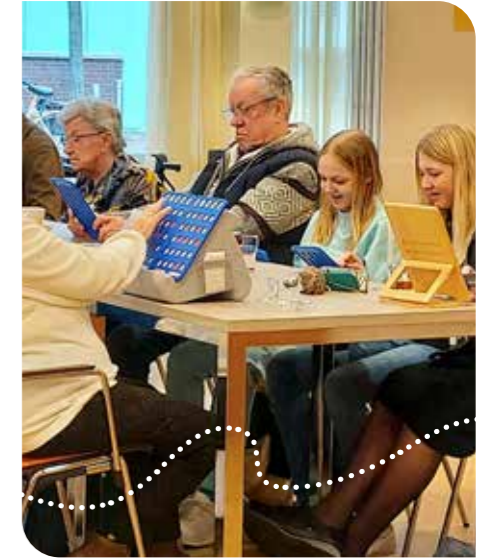
Bingo op zondag in wijkcentrum Hof van Heden Naaldwijk

High tea, optreden van een popkoor, sjoelwedstrijd, paasbingo... Het is slechts een greep uit de diverse ontmoetingsactiviteiten, die mogelijk gemaakt zijn via de regeling.