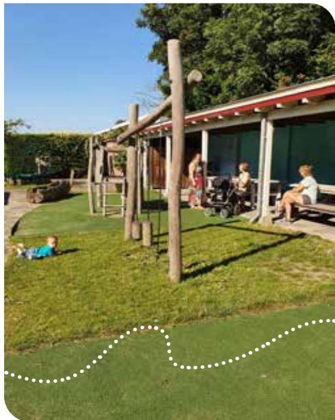
Zomerse Kids & Koffie-ochtend

M ooi en bijzonder, moeder of vader worden, maar soms zien kersverse ouders hun wereld ongewild kleiner worden. Daarom is er op steeds meer locaties in Westland 'Kids & Koffie'. Een ontmoetingsochtend waar jonge ouders gezellig een bakkie kunnen doen, ervaringen kunnen delen, elkaar kunnen opzoeken voor vragen en waar kinderen tot 4 jaar onbezorgd kunnen spelen.