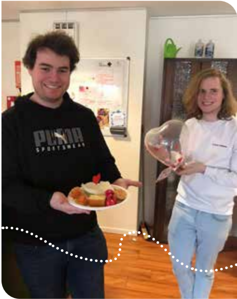
Valentijns High Tea door trainees bij Pieter van Foreest Vlietzicht Wateringen

J ong geleerd is oud gedaan. Hoe zorg je ervoor dat jongeren al vroegtijdig maatschappelijk betrokken raken? Het Vrijwillig Traineeship (VT) is een passend antwoord op die vraag. Het project biedt jongeren van 15 tot 27 jaar de kans op persoonlijke en professionele ontwikkeling door kennismaking met vrijwilligerswerk.