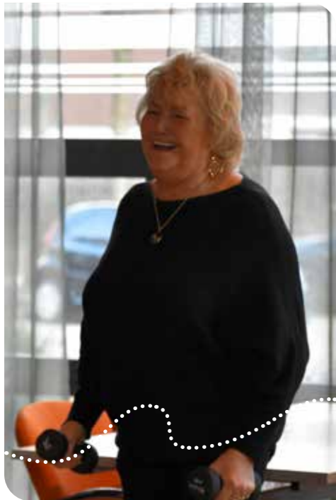
Meer Bewegen voor Ouderen in wijkcentrum Terra Nova Wateringen

E r wordt weleens gezegd dat bewegen het goedkoopste medicijn is met de gezelligste bijwerking. Voldoende lichaamsbeweging is belangrijk voor iedereen, maar nog net een beetje extra voor senioren. De wijkcentra van Vitis Welzijn spelen daarop in met beweegaanbod voor mensen met ouderdomsmotoriek: ‘Meer Bewegen voor Ouderen’.