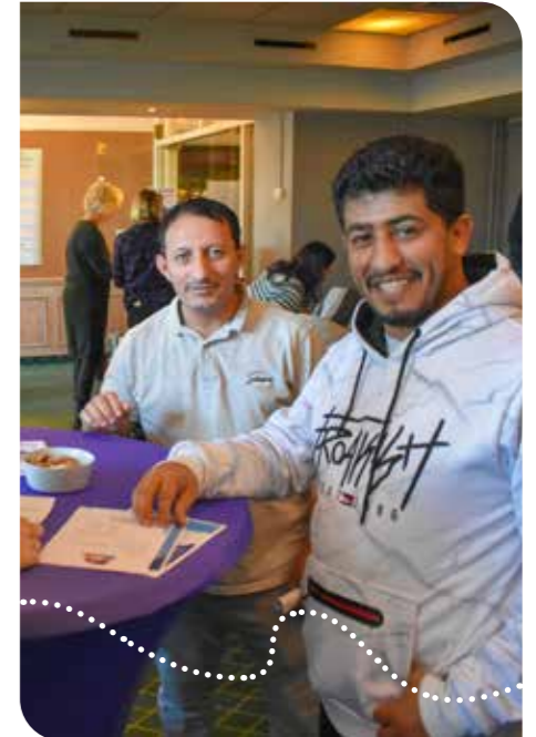
Meedoen Markt in voormalig Fletcher Hotel Naaldwijk

Bezoekers troffen op 30 november 2023 een divers gezelschap aan standhouders; van kringloopwinkel De Recycling en Vrienden van het Staelduinse Bos tot tafeltennisvereniging SVN.