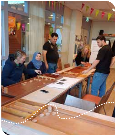
Oud Hollandse spellen spelen in het kader van het Participatieverklaringstraject (PVT)

E en onderdeel van inburgering is dat nieuwkomers leren wat in Nederland belangrijk is en hoe zij kunnen meedoen in de maatschappij. Vitis Welzijn is in 2023 in samenwerking met Patijnenburg gestart als nieuwe aanbieder van dit zogenoemde participatieverklaringstraject.