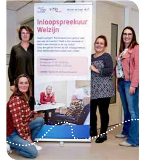
Inlooppreekuur Welzijn op Recept in het Reinier de Graaf ziekenhuis