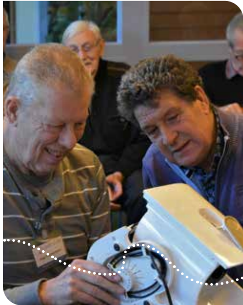
Repair Café in wijkcentrum Hooge Hasta Naaldwijk

E en lamp ophangen, een fietsband plakken of een stekker monteren. De kunst van zelf simpele karweitjes klaren, is aan het verdwijnen. Klusvaardigheden worden steeds minder van huis uit meegegeven en dat maakt mensen onzeker. ‘Westland leert klusjes’ speelt in op de onervaren klusser.