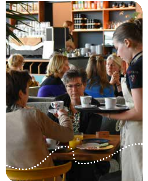
Mantelzorgontmoeting in The Vineyard Monster

Verschillende organisaties – profit en non-profit – waren tijdens de informatiemarkt aanwezig om hun diensten, producten, kennis en netwerk aan te bieden om mantelzorgers te helpen te kunnen (blijven) zorgen. Naast struinen over de markt konden bezoekers ieder uur een presentatie bijwonen. De middag was ook bij uitstek een gelegenheid om andere mantelzorgers te ontmoeten en tips en ervaringen uit te wisselen. “Contact met andere mantelzorgers verbindt. Niemand begrijpt je zo goed als degenen die in hetzelfde schuitje zitten. Dat stukje (h)erkenning kan erg fijn zijn. Daarom verzorgt Vitis door het jaar heen ontmoetingen voor mantelzorgers.”