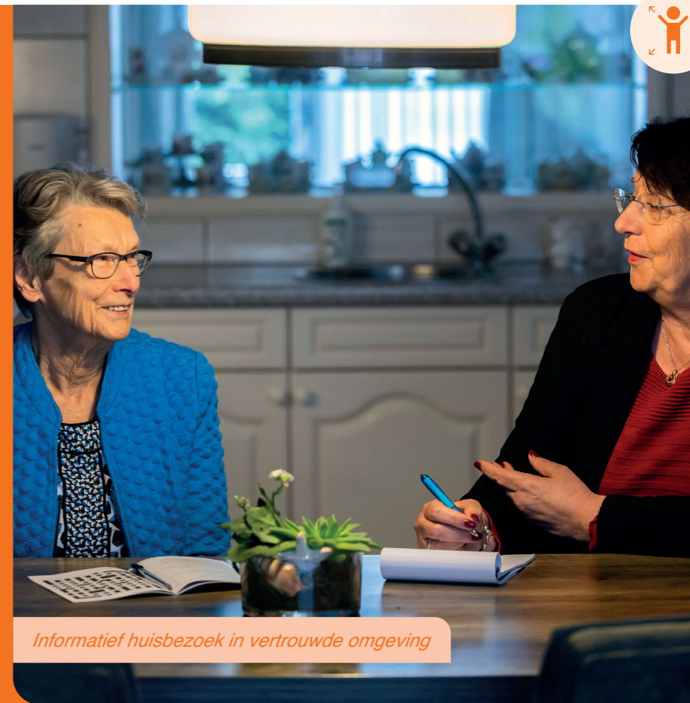
Informatief huisbezoek in vertrouwde omgeving