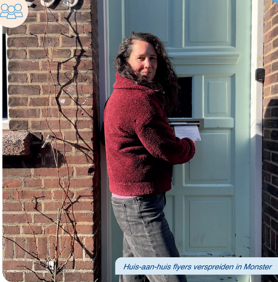
Huis-aan-huis flyers verspreiden in Monster