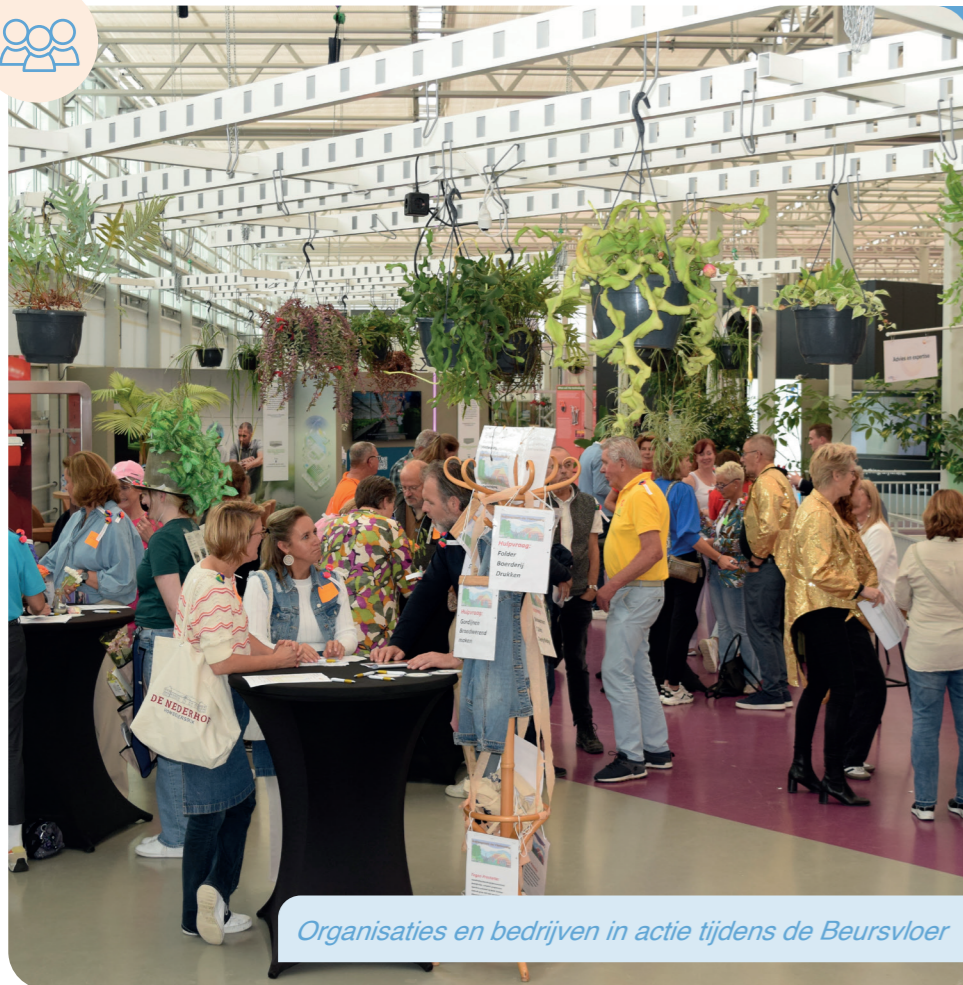
Organisaties en bedrijven in actie tijdens de Beursvloer