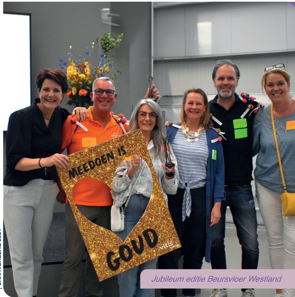
Jubileum editie Beursvloer Westland