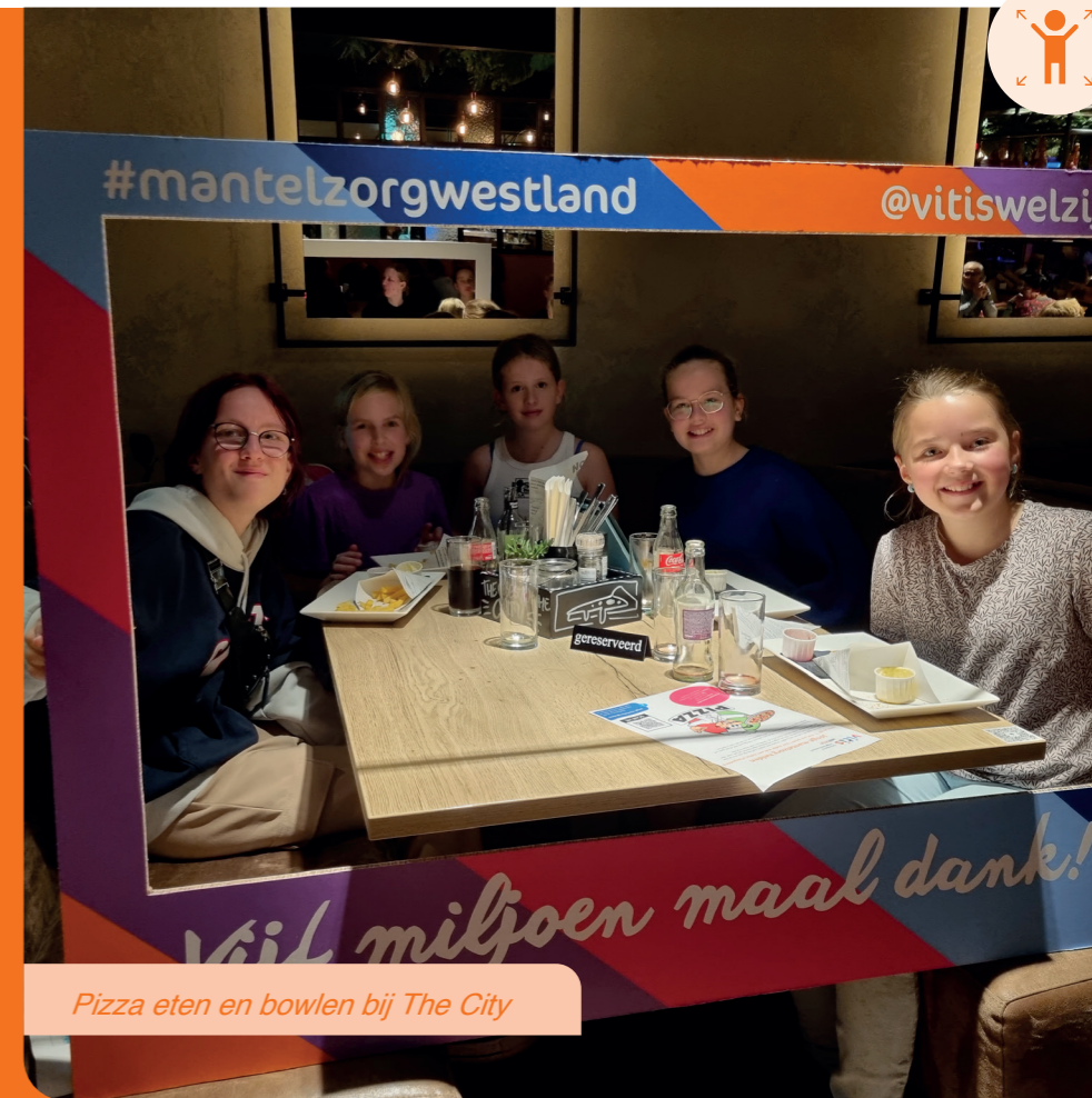
Pizza eten en bowlen bij The City