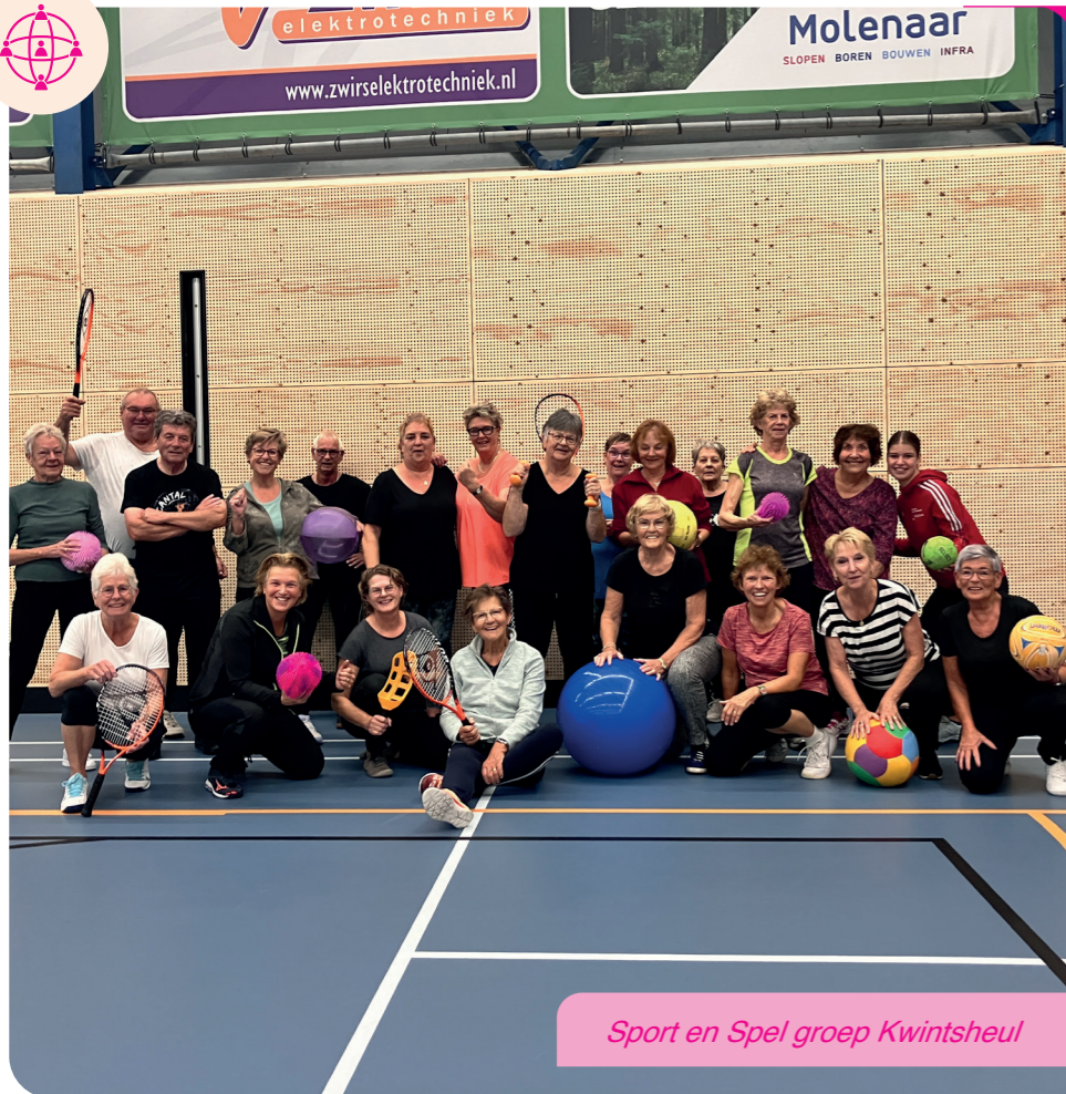
Sport en Spel groep Kwintsheul