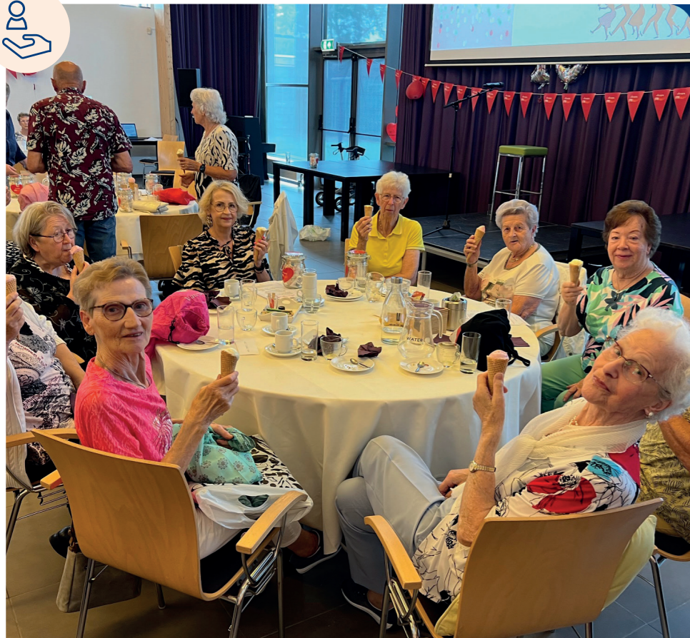
Ruim 100 deelnemers en vrijwilligers kwamen samen voor het jubileumfeest