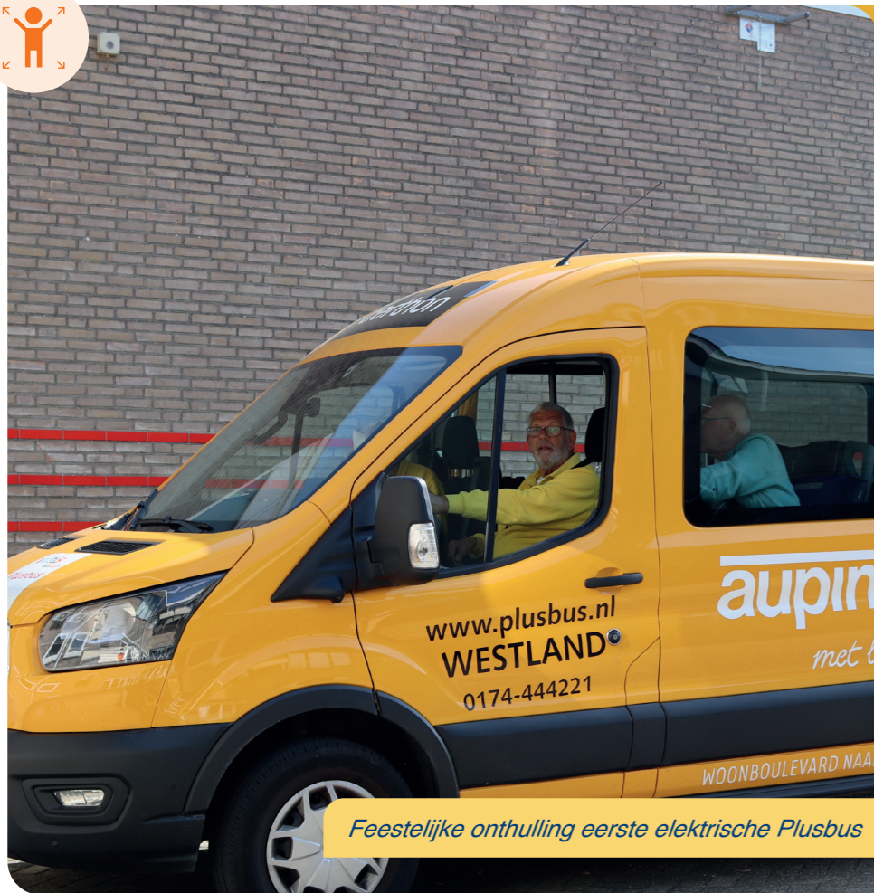
Feestelijke onthulling eerste elektrische Plusbus