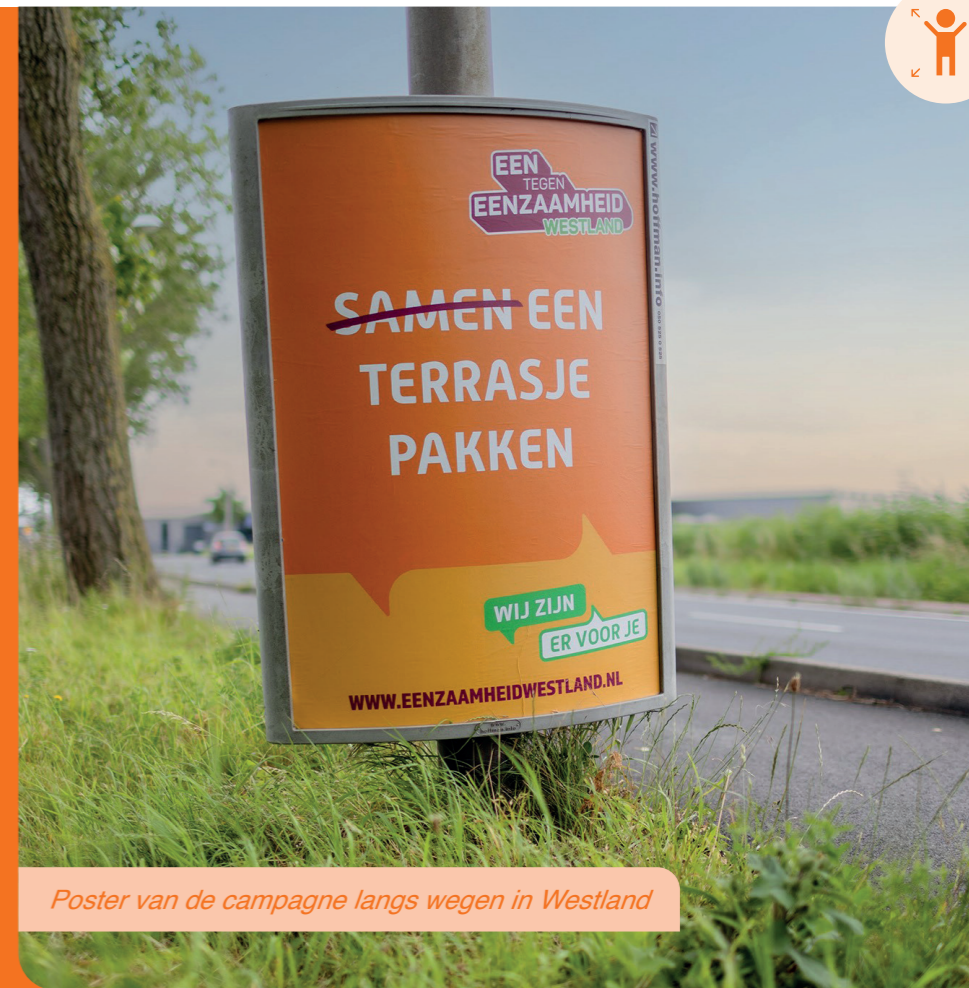
Poster van de campagne langs wegen in Westland

De campagne had als doel bewustzijn te creëren en zette het onderwerp eenzaamheid op de kaart. Vanwege het succes volgde een decembereditie.