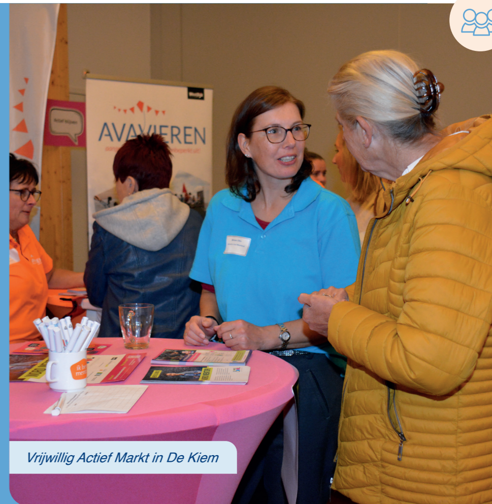
Vrijwillig Actief Markt in De Kiem

Vitis organiseert de vrijwilligersmarkt twee keer per jaar. De voorjaarseditie is altijd in winkelcentrum De Tuinen en richt zich breed op potentiële vrijwilligers, terwijl de najaarseditie, zoals deze in De Kiem, inspeelt op actualiteiten en vernieuwingen in het vrijwilligerswerk. Zo blijft de markt dynamisch en afgestemd op de behoeften van vrijwilligers en organisaties.