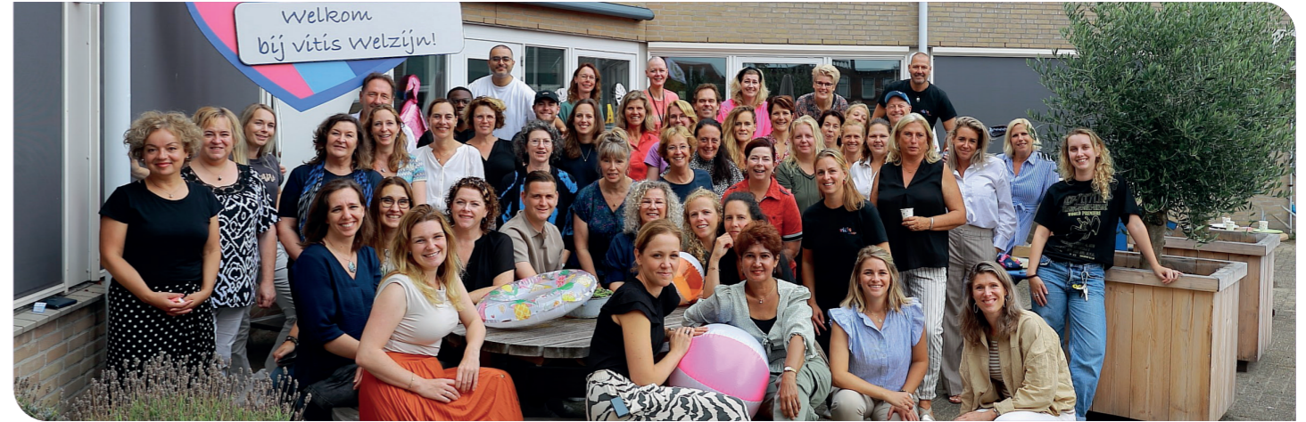
Medewerkers Vitis Welzijn

Voor vragen over dit jaarverslag kunt u contact opnemen met de afdeling communicatie via communicatie@vitiswelzijn.nl of 0174 - 630358.