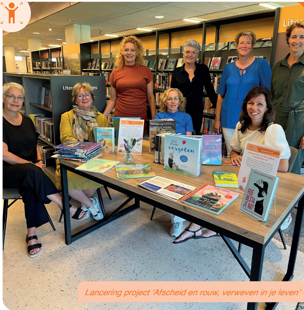
Lancering project 'Afscheid en rouw, verweven in je leven'