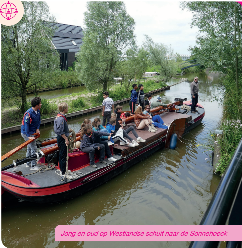
Jong en oud op Westlandse schuit naar de Sonnehoeck