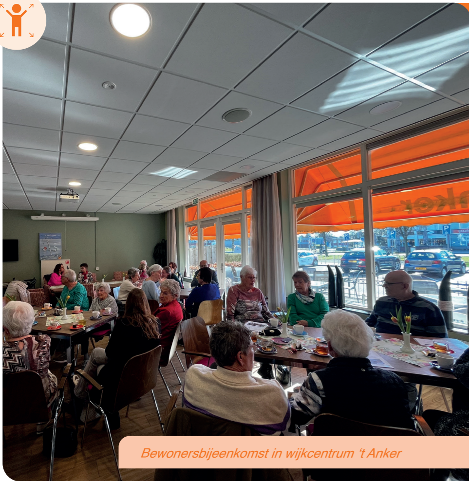
Bewonersbijeenkomst in wijkcentrum 't Anker