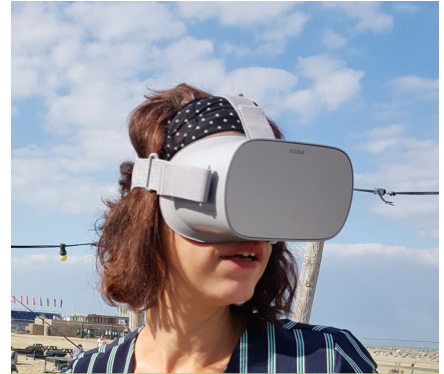
Ontwikkeling VR | Enemy or Friend?