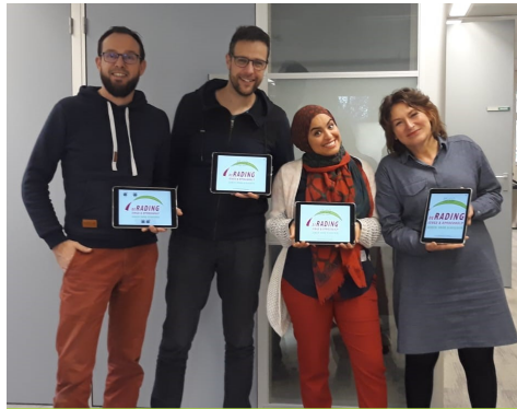
Gebruik videobeelden bij behandelingen AVG-proof