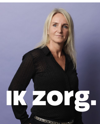
De Rading doet mee aan landelijke Ik Zorg-campagne