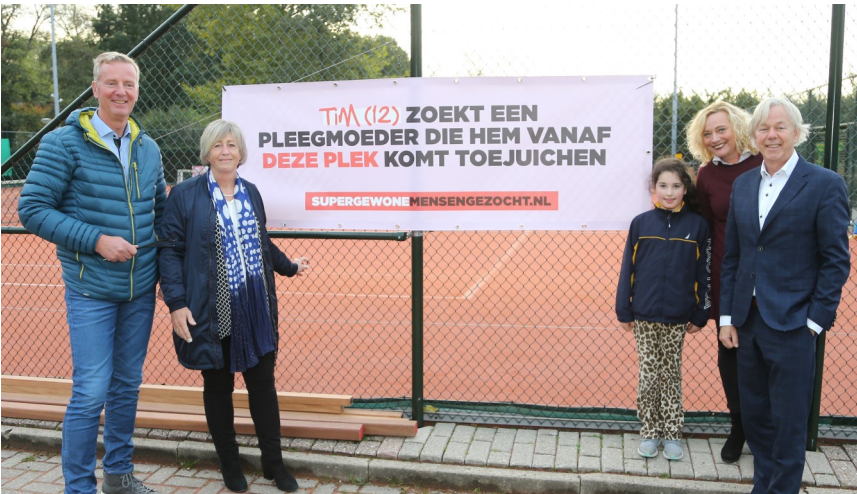
63 sportverenigingen ondersteunen actief Week van de Pleegzorg