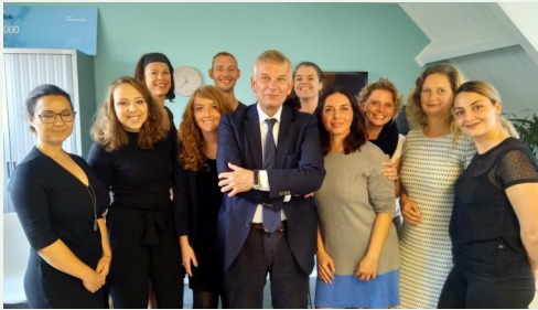
Team Pretty Woman in gesprek met de Nationaal rapporteur Mensenhandel Herman Bolhaar (foto links) en minister Grapperhaus (foto rechts).

Minister Grapperhaus, Justitie en Veiligheid, praat daarnaast meermaals met de professionals van Pretty Woman over de risico's van sexting en grooming. Mede op basis van die gesprekken wil de minister de wetgeving over seksueel overschrijdend gedrag rondom exposen aanscherpen.