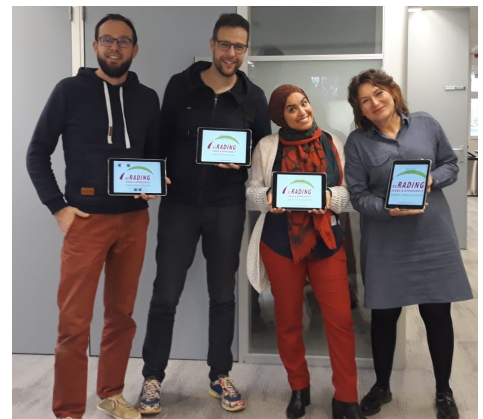
MDFT-team neemt beveiligde omgeving voor videobeelden van behandeling in gebruik.

“Doordat ik het gevoel had dat je aan mijn kant stond, kreeg ik weer energie voor de opvoeding. Ik was zo blij met je oprechte compliment bij het gesprek op school”. Reactie van een moeder na MDFT.